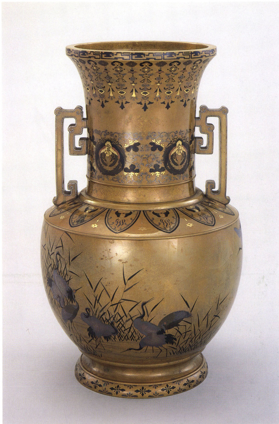
25 水野源六(第九代) 〈茶真鍮金銀象嵌群鶴葦文花瓶〉 明治43年(1910)